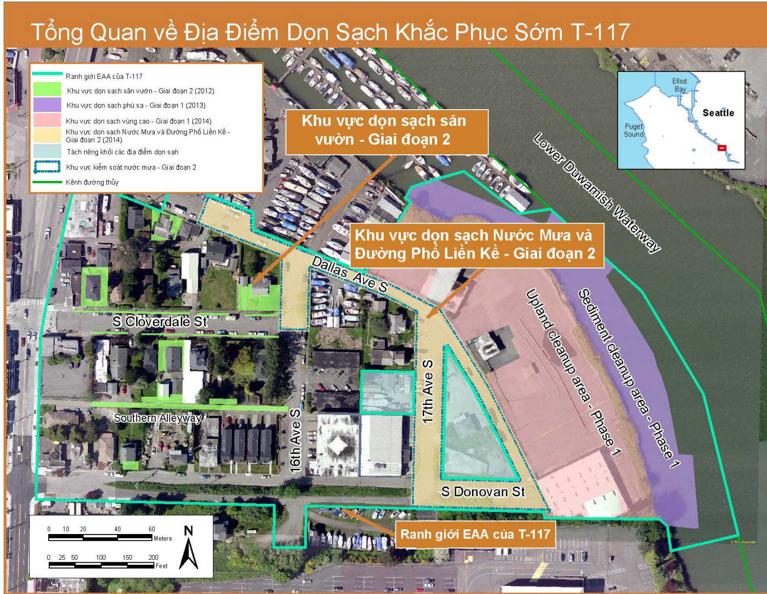
Hình 1. Bản đồ chụp từ trên không cho thấy các Khu Vực Khắc Phục Ban Đầu được đề nghị xung quanh địa điểm T-117.